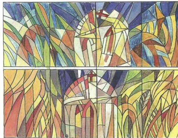
Projectes de vitralls realitzats per Skudlik, el 2009, específicament per a l'església dels sants Cosme i Damià, del Prat. Al·legories que arrodoneixen els conjunts representatius de l'Església patidora i l'Església triomfant respectivament.