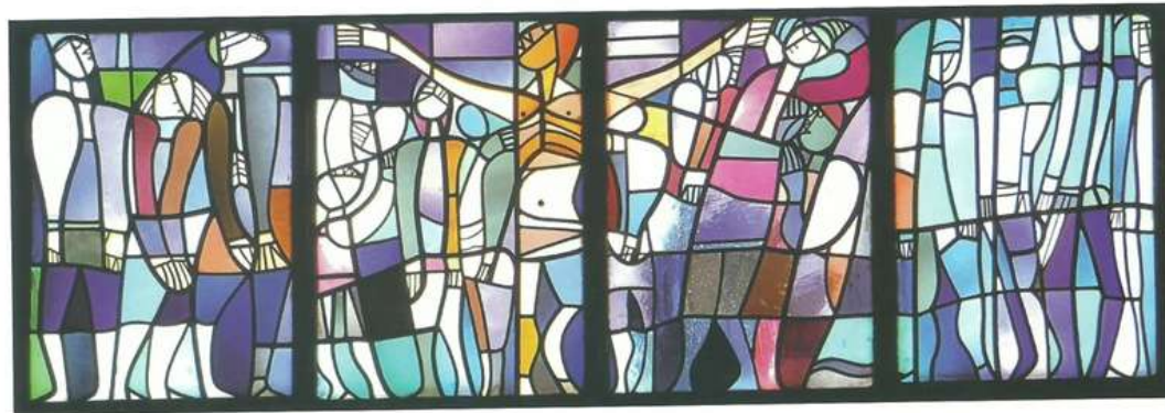
La salvació de la humanitat també arriba per a aquells que han estat víctimes dels bombardejos, gent famolenca, han patit de la guerra en general. El seu pelegrinatge els du al costat de la Creu del Senyor.

en un pelegrinatge de dolor i lluita. Responen a l'advertiment del llibre de l'Apocalipsi. Es posa l'èmfasi en l'especial crueltat amb què s'ha manifestat la caiguda de la naturalesa humana, i que Skudlik va viure en primera persona. El seu recull apocalíptic no segueix fil per randa el text neotestamentari, tal i com es fa en les miniatures dels Beats, o en les il·lustracions de la societat bíblica Watch Tower . Skudlik el redimensiona donant-li actualitat i emparentant-lo, en l'aspecte conceptual i ensems formal, amb el Gernika picassà. Així és com apareixen nous aspectes dolorosos, que Aiginger reconeix. Aquest diu que hi ha un camí de cadàvers; nosaltres afegim que, per sobre d'aquests, avança un carro de combat. Aiginger hi veu