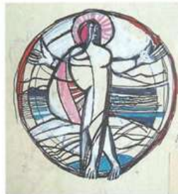
La figura de Crist com a totpoderós és la principal del conjunt de vitralls que mostren l'Església triomfant. Amb el títol de Pantocràtor també es troba referenciat el dibuix que l'autor fa del Crist que avança caminant.

d'esperança cristiana que posa els ulls en el demà. Són visions joàniques relatives a la fi dels temps , amb una gentada de testimonis del nom de Crist. En representació hi figuren bisbes, laics, reis, treballadors i santes dones, com a poble de Jesús benaurat. La imatge més destacable: Crist com a totpoderós sobre la Jerusalem celestial , envoltat d'àngels joiosos i tocant música. Aquest és el somni que Aiginger també identificà. Trobem làmpades enceses, la lloança de 144.000 marcats; molts que agiten palmes (Ap 7,9).