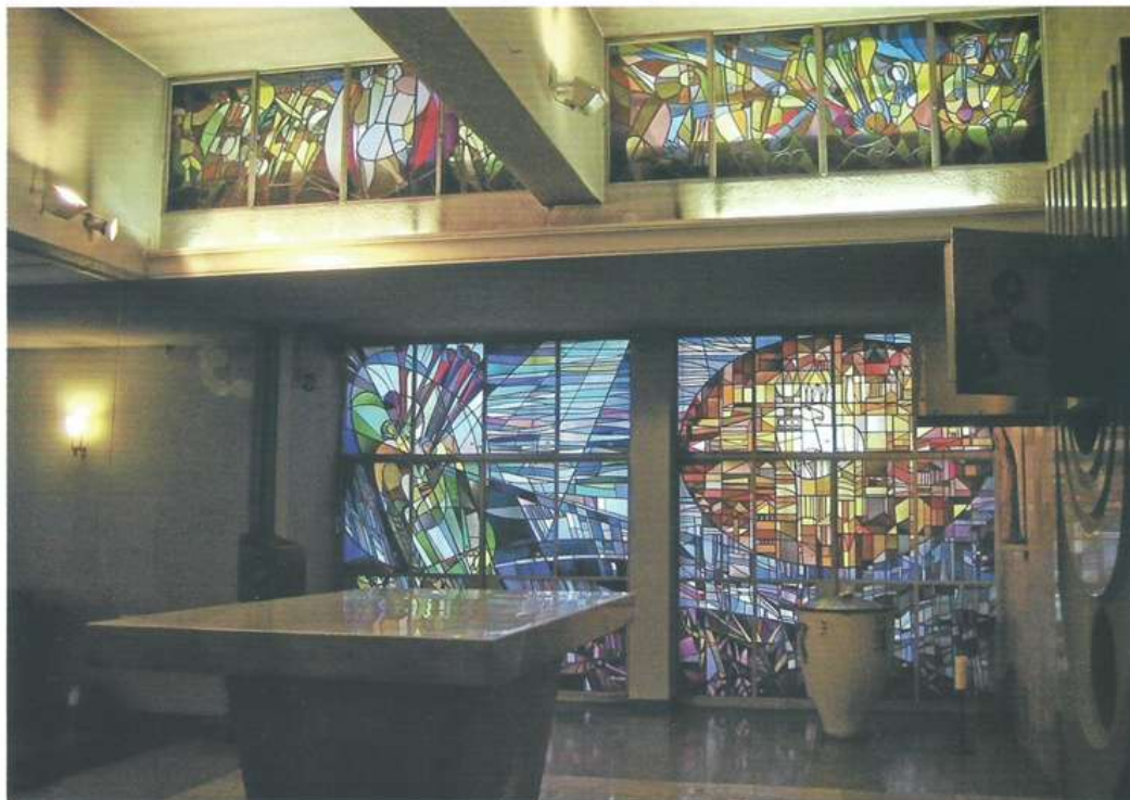
Distribució original d'alguns dels vitralls "apocalíptics" encara a la parròquia alemanya de Barcelona.