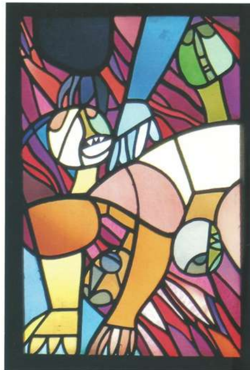
Plafó on s'aprecia com els botxins empenyen les víctimes cap a les cambres crematòries d'un camp d'extermini.